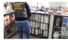
El Seprona desmantela una fábrica de productos legales e identifica los canales por los que comercializaban los mismos